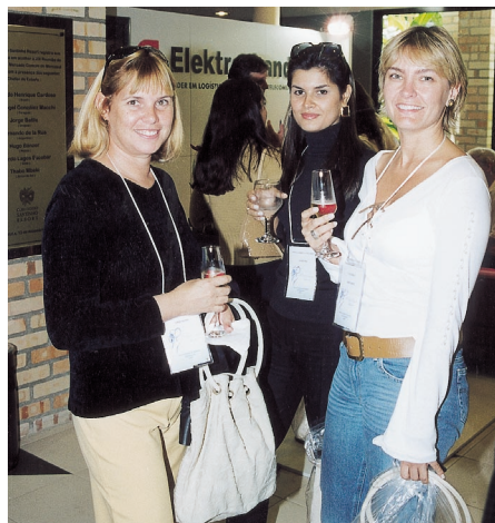
Ala feminina em confraternização

total, foram 25 prêmios, incluindo cinco finais de semana (com direito a acompanhante) em hotéis de luxo no Brasil e no Uruguai, além de pastas executivas, telefones, jóias e perfumes, entre outros. A confraternização do público feminino, um dos objetivos do encontro, ficou clara nos intervalos, brindados com flûte champagne . Outros momentos de arte e descontração foram proporcionados na palestra “Introdução ao mundo do vinho”, com o bem-humorado somelier Angelo Fornara; e com a exibição das peças da “Usina das Artes”, de Santa Catarina.