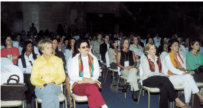
Sucesso de público: mais de 300 participantes

O engajamento social, presente desde a primeira realização do evento, voltou a ter espaço destacado. Durante três dias, ficaram em exposição, no Costão do Santinho, peças produzidas por alunos da